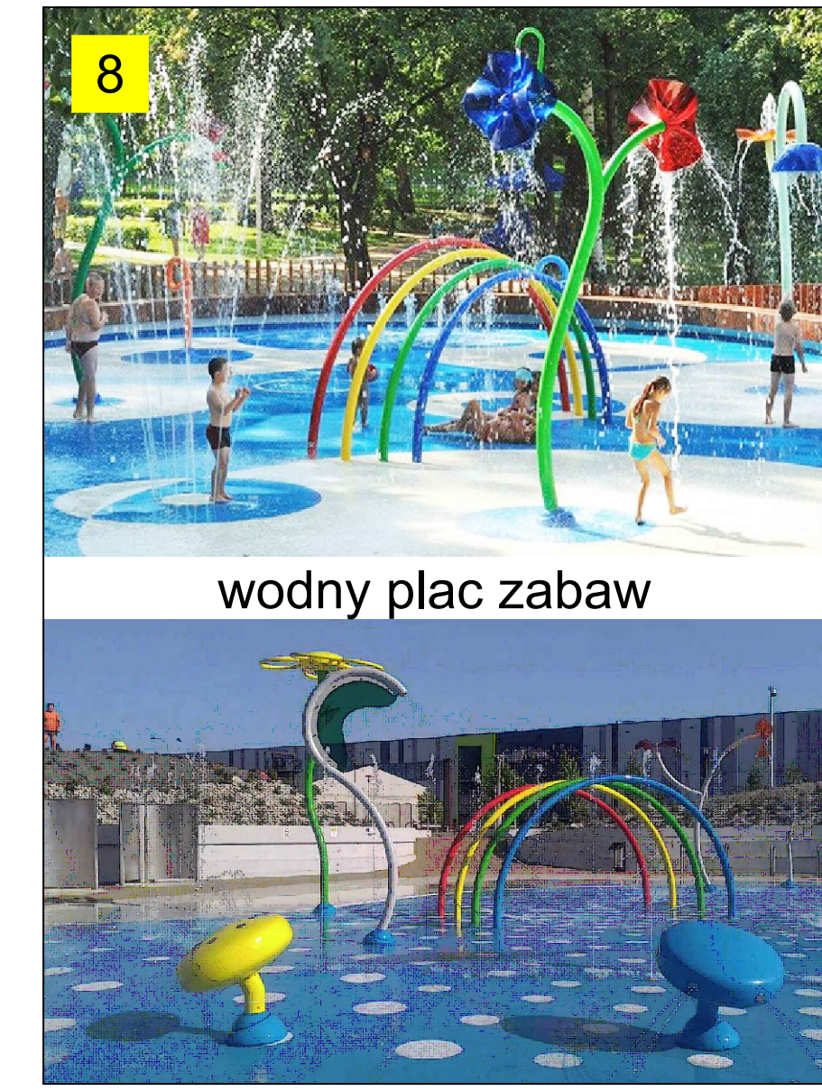
wodny plac zabaw