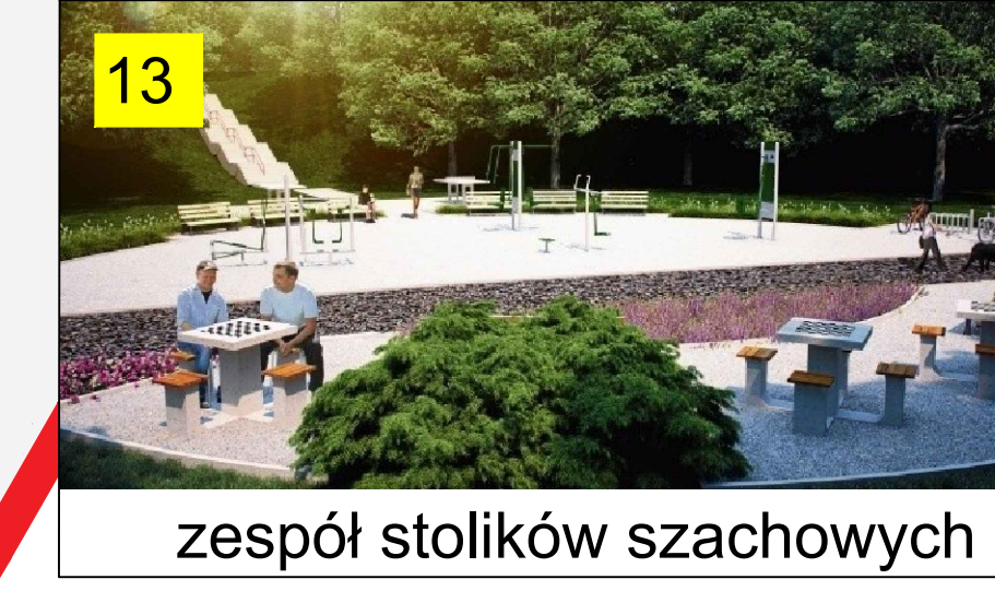
zespół stolików szachowych