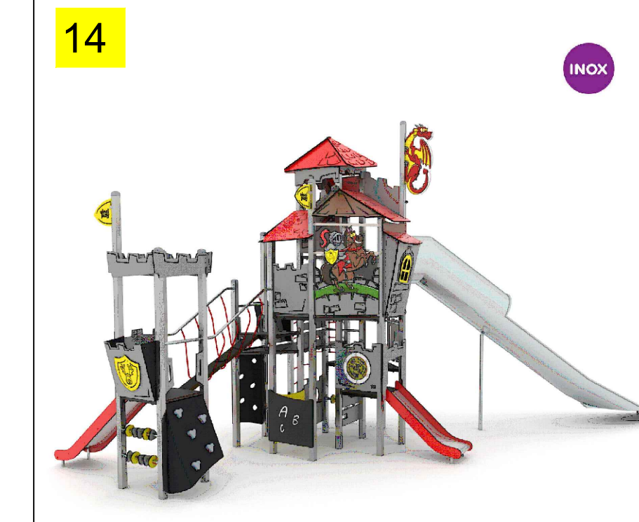
poszerzenie oferty istniejącego placu zabaw o zamek ze zjeżdżalnią