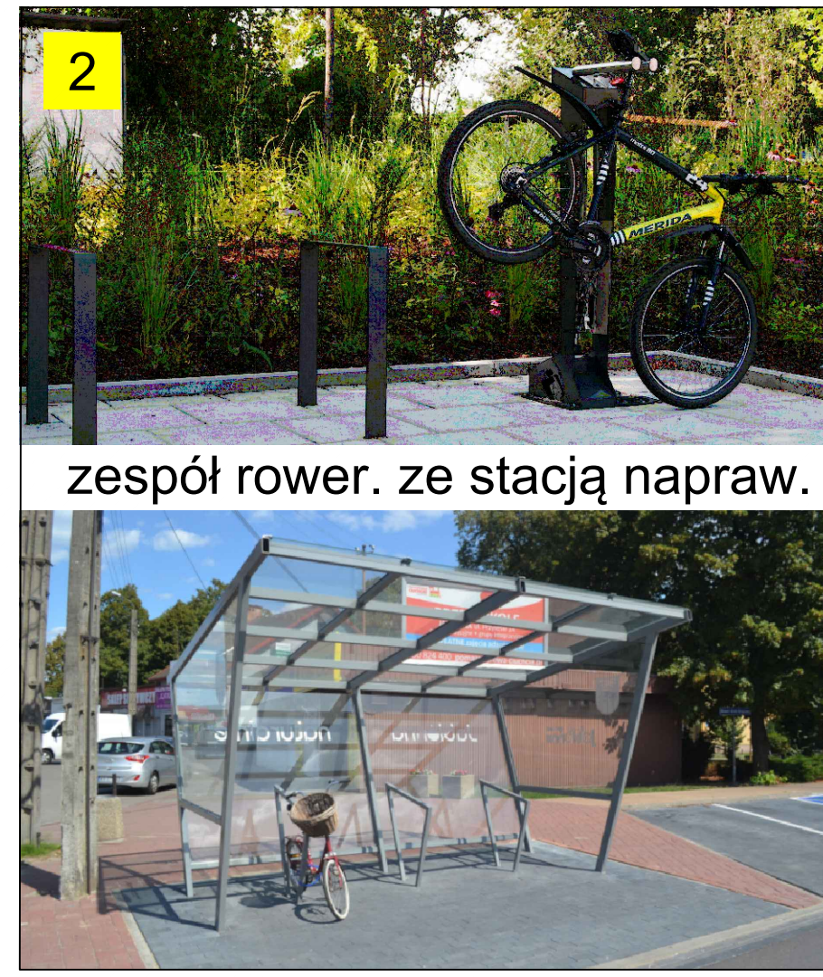
zespół rower. ze stacją napraw.