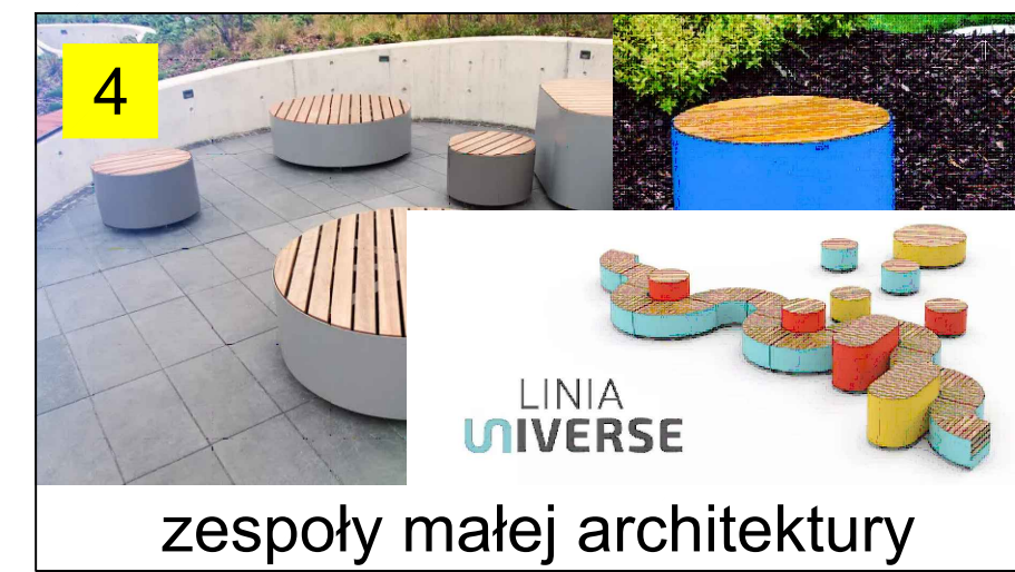
zespoły małej architektury