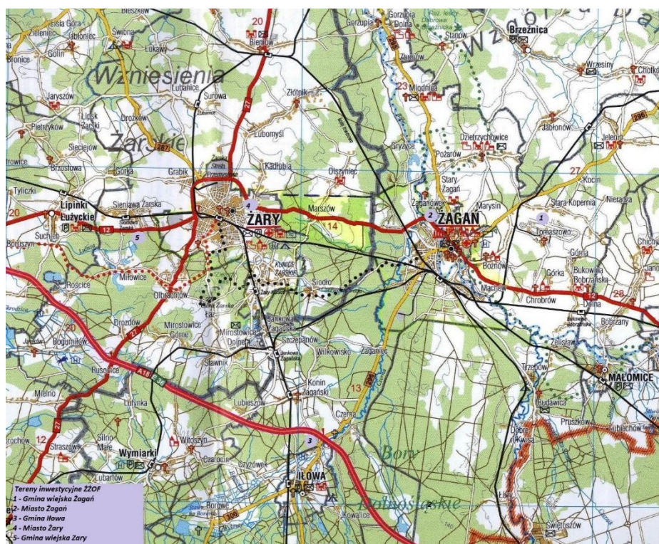
Mapa 1 Tereny inwestycyjne na obszarze gmin ŻŻOF

Każda z gmin przygotowała własne propozycje dodatkowych wydatków inwestycyjnych w tym zakresie. Wspólne mogą być w przyszłości działania promocyjne w celu przyciągnięcia do regionu ŻŻOF nowych inwestorów. Lokalizację działek przewidzianych do uzbrojenia przedstawia mapka poniżej.