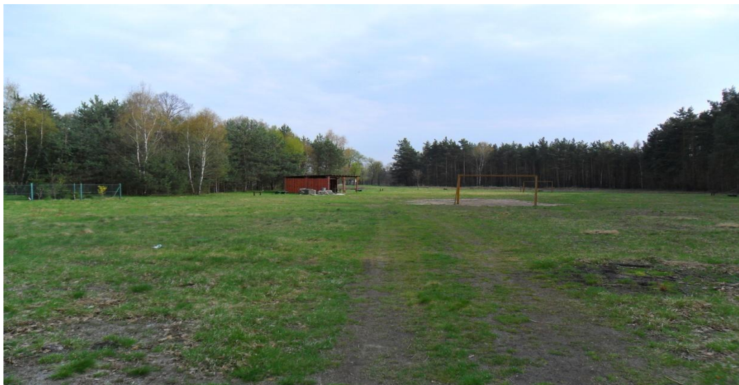
Stan boiska obecnie (zdjęcie z kwietnia 2011 r.)