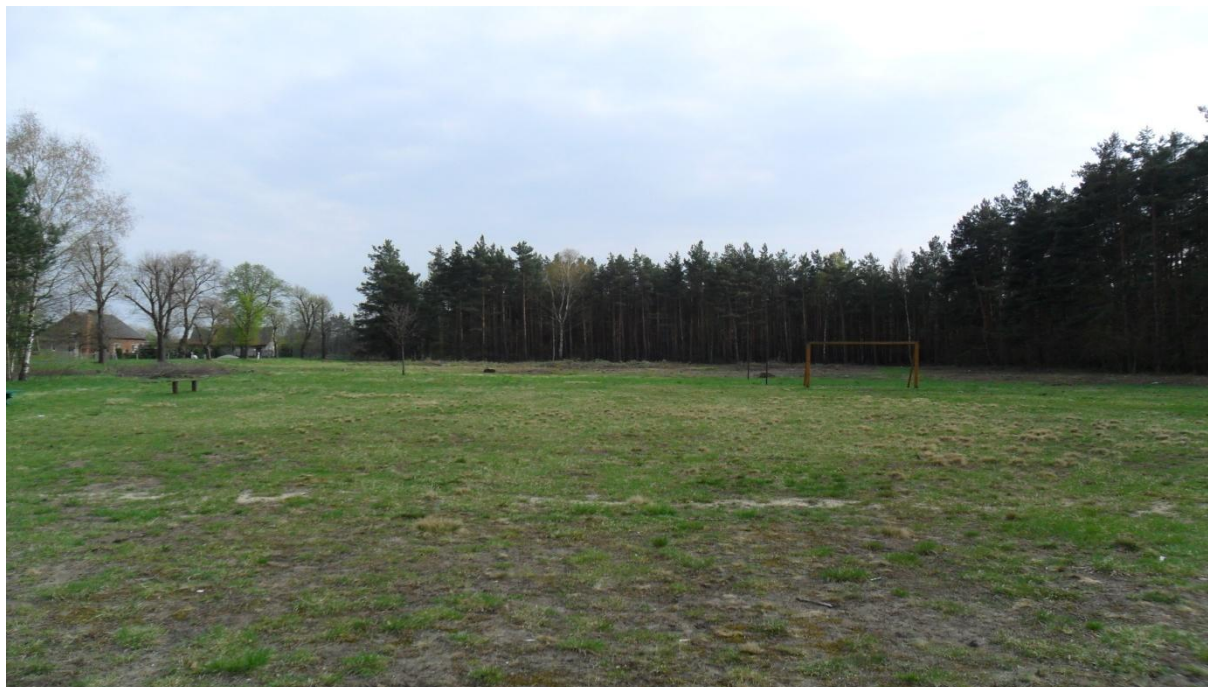
Zdjęcie terenu przy boisku przygotowanego do urządzenia wiejskiego placu zabaw (zdjęcie z kwietnia 2011 r.)