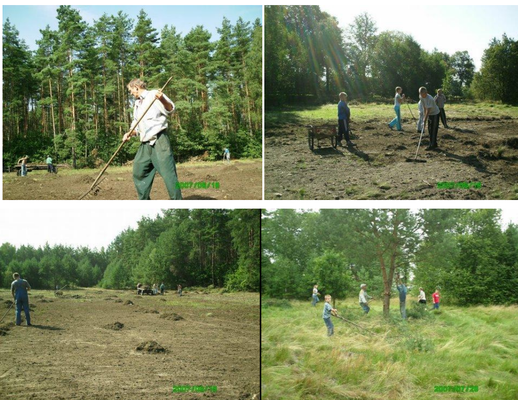
Zdjęcia z prac przy porządkowaniu boiska.

W miejscowości nie ma zarejestrowanych organizacji pozarządowych. Dużą wartością mieszkających tu ludzi jest ich zaangażowanie w życie społeczne wsi. Przykładem może być zaangażowanie mieszkańców przy przywracaniu świetności naszego boiska. W czasie prac brali udział mieszkańcy z całego przekroju wiekowego naszej wsi. Wiedzieliśmy wówczas że nie mamy szans na ORLIKA. Pracowaliśmy z myślą, iż wcześniej mieliśmy tu klepisko, a teraz będzie to nasze wiejskie boisko.