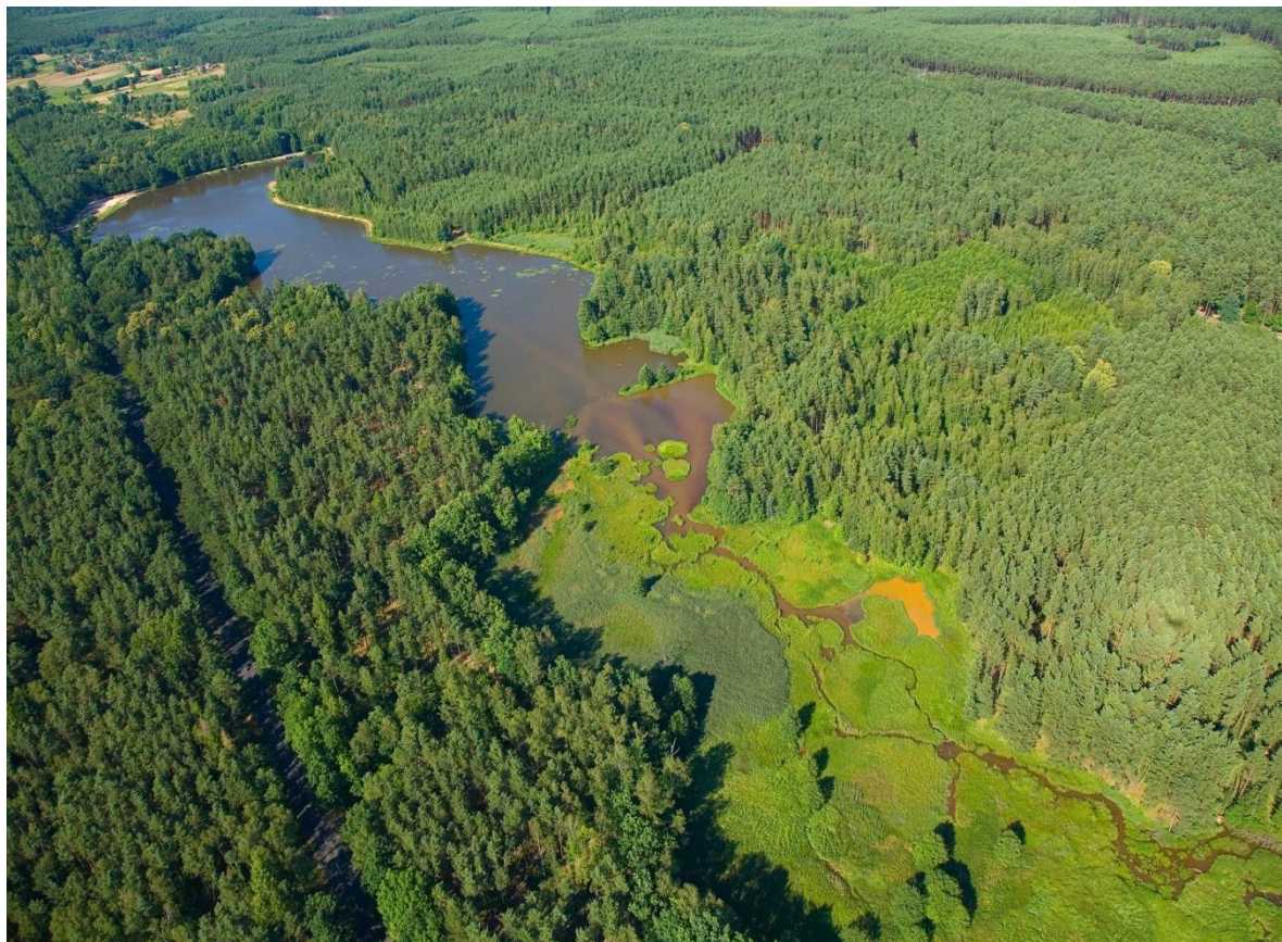
Zalew w Klikowie z lotu ptaka