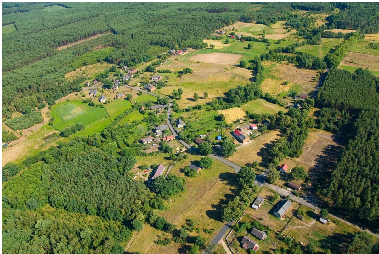
Klików z lotu ptaka

powszechnie obowiązującą nazwą „Zalew w Klikowie”. Zalew jest miejscem wypadowym dla wędkarzy oraz służy jako miejsce wycieczek rowerowych m.in. dla wielu mieszkańców miasta Iłowa. W okolicznych lasach znajdują się ruiny dawnej zabudowy mieszkaniowej.