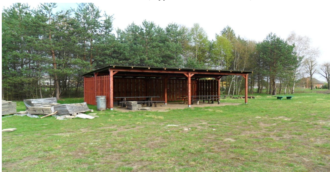
Wiata przy boisku – wykonana w ramach Funduszu Sołeckiego (zdjęcie z kwietnia 2011 r.)