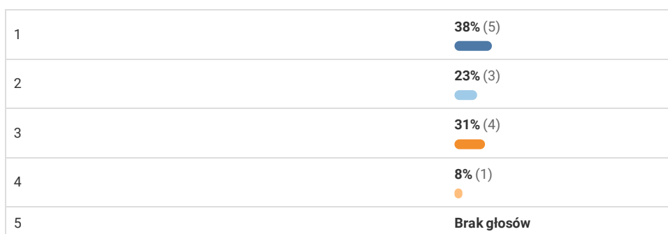
Wykres 7. Jak oceniasz pozostałą infrastrukturę rowerową (stojaki do przypięcia roweru, wiaty rowerowe, etc.) w Twojej okolicy? (gdzie 1 oznacza zdecydowanie niewystarczająca, a 5 oznacza zdecydowanie wystarczająca)

Liczba głosów oddanych na poszczególne odpowiedzi kształtowała się od 0 do 5 co prezentuje Wykres.