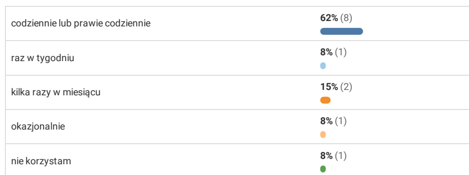
Wykres 2. Jak często korzystasz z roweru?