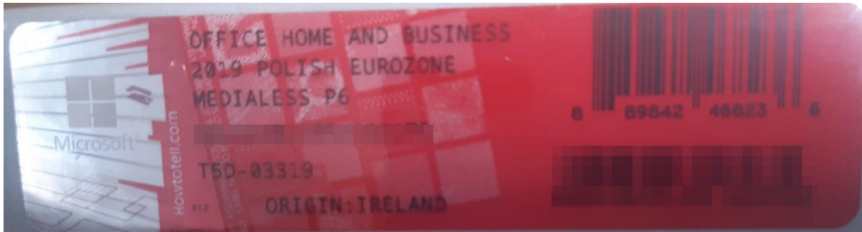
Rys. 2 przykładowy kod zabezpieczony przez producenta systemu Microsoft Windows Office Home&Business z wymazanym, znajdującym się w prawym dolnym rogu numerem seryjnym produktu. Kod licencyjny znajduje się w środku szczelnie zapakowanego i zafoliowanego pudełka